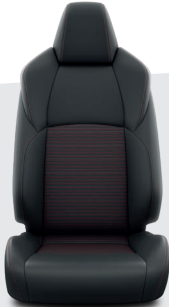
Sellerie en cuir synthétique sport noir avec surpiqûres rouges DESIGN BUSINESS