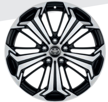
Jantes en alliage 19" Kalleis COLLECTION