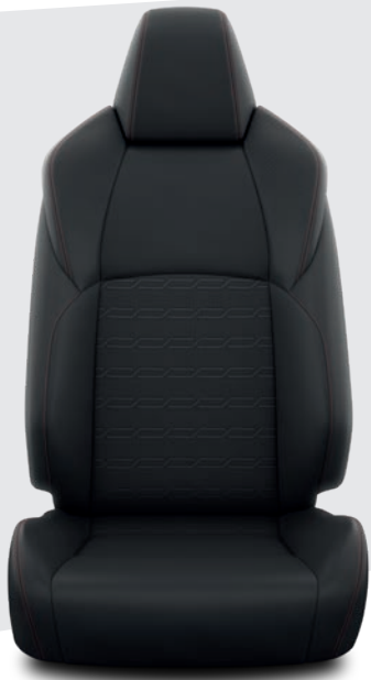
Sellerie tissu sport noir avec surpiqûres rouges DESIGN