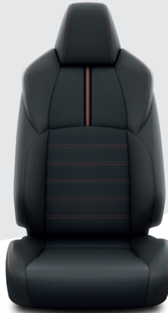
Sellerie en cuir noir avec surpiqûres rouges COLLECTION