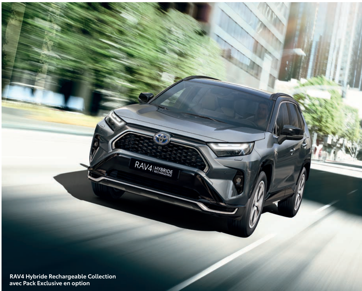
RAV4 Hybride Rechargeable Collection avec Pack Exclusive en option