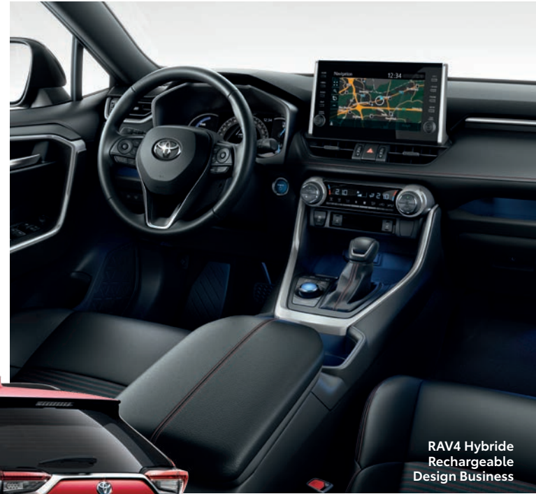
RAV4 Hybride Rechargeable Design Business