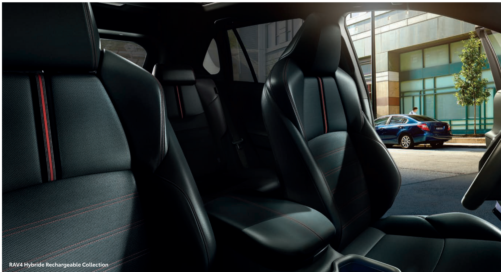
RAV4 Hybride Rechargeable Collection