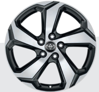
Jantes en alliage 18" Eole DESIGN DESIGN BUSINESS